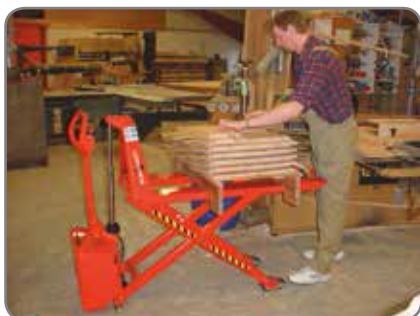
Zubehör: Fernbedienung, Positionskontrolle, Bremse, Ladegerät (extern oder eingebaut).