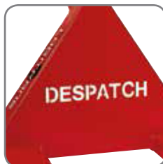
Die Deichsel kann mit Name/Abteilung gekennzeichnet werden.