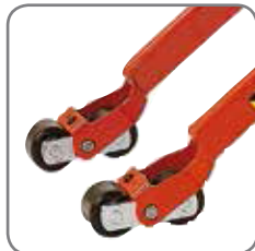
Die Tandem-Gabelrollen haben eine Bremsicherung und schonen den Boden.