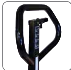
Die ergonomisch geformte Deichsel sorgt für einen entspannten Griff.