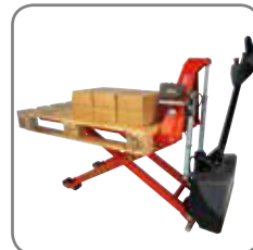
Die Positionskontrolle (Zubehör) hält die Arbeitshöhe konstant.