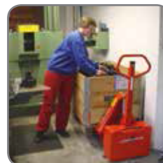
Patentierter Zylinder-Konstruktion ergibt eine niedrige Bauhöhe.

Gerne bieten wir Ihnen auch kundenspezifische Lösungen an. Besuchen Sie auch www.logitrans.com