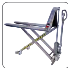
Manuell, elektrisch rostfrei und explosionsgeschützt.