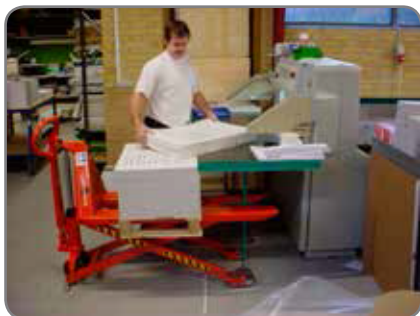
Der manuelle Scherenhubwagen hat sehr niedrige Pumpkraft, Fußschutz und Neutralstellung.

* Tragkraft reduziert sich von 1500 auf 1000 kg ab der Hubhöhe von 470 mm.