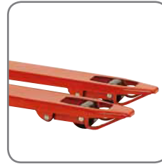
Gleitbügel an den Gabelspitzen ermöglichen ein einfaches und leichtes Hinein- und Herausfahren aus Paletten.