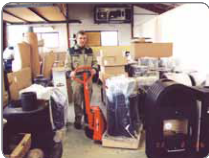
Auch in sehr schmalen Gängen können Güter problemlos transportiert werden.