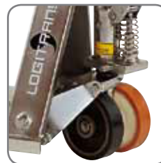
Für jeden Einsatzzweck gibt es die passenden Räder.