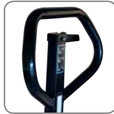
Die ergonomische Deichsel gewährt einen entspannten Griff. Die Deichsel kann mit Name/Abteilung gekennzeichnet werden.