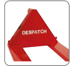
Firmennamen bzw. das Logo des Kunden können im Dreieck des Wagens ausgeschnitten werden.