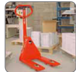
Mit vielen verschiedenen Gabellängen erhältlich.

Gerne bieten wir Ihnen auch kundenspezifische Lösungen an. Besuchen Sie auch www.logitrans.com